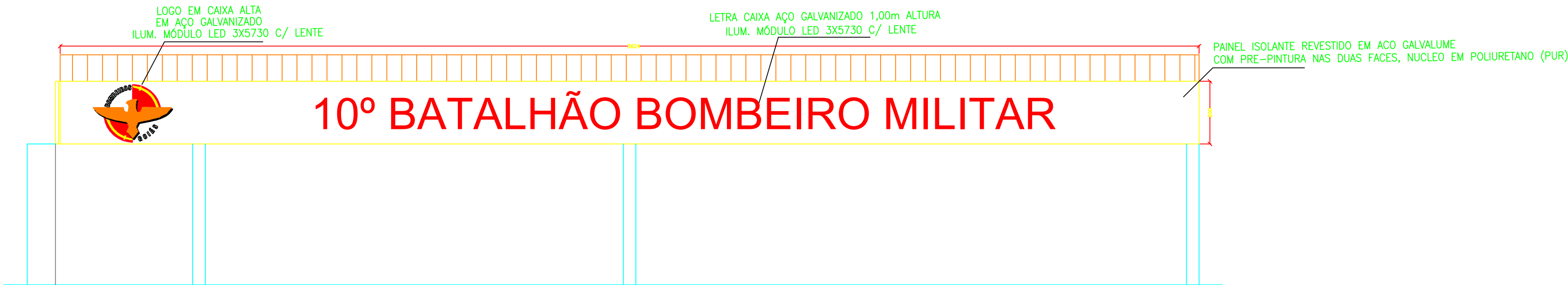
FACHADA GARAGEM VTR Esc: 1:100