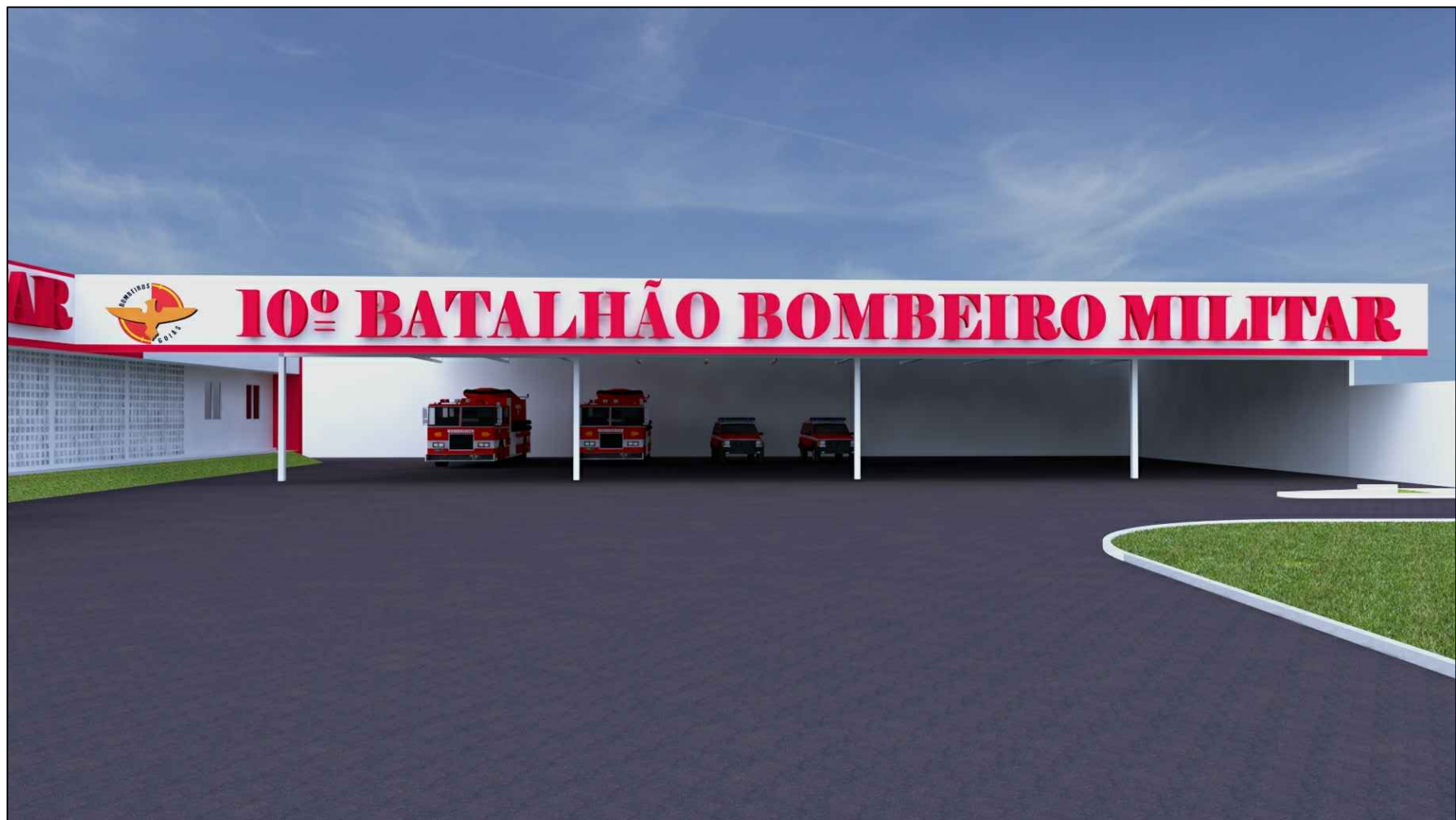
PERSPECTIVA GARAGEM VTR